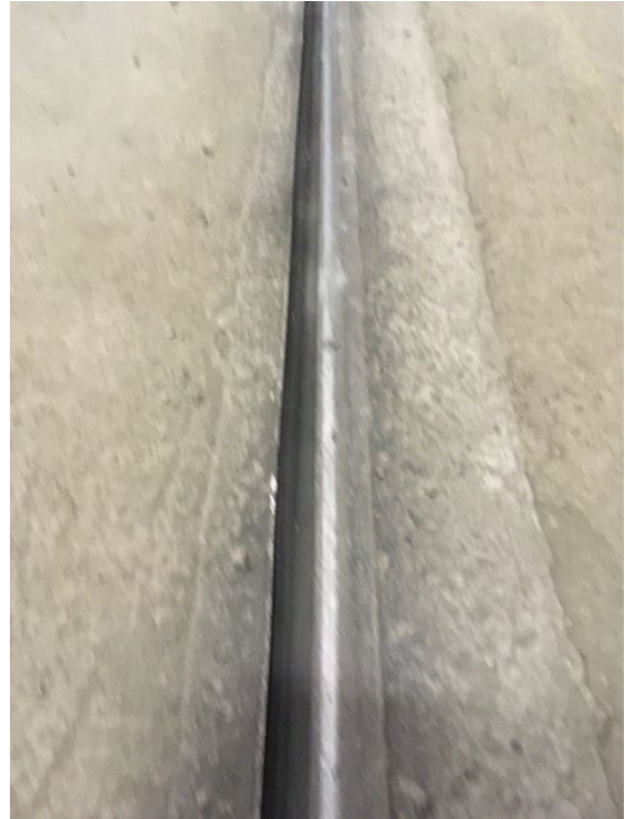
Skinner med tætning

SP-SRS Submerged Rails System er et skinnesystem, som er helt plant med gulvet. Systemet er unikt, hvor en komprimeret tætning forhindrer skidsamling i sporet.