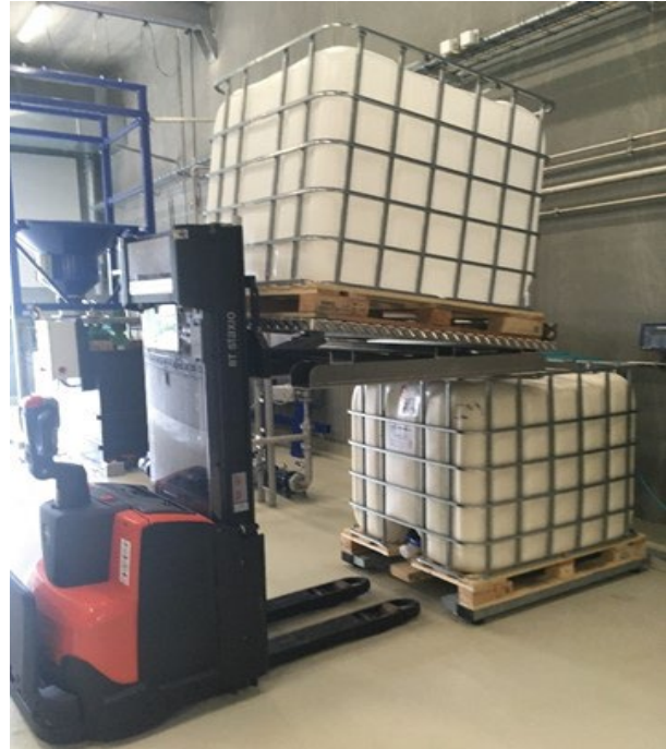
SP-Tilt håndteret med stabler