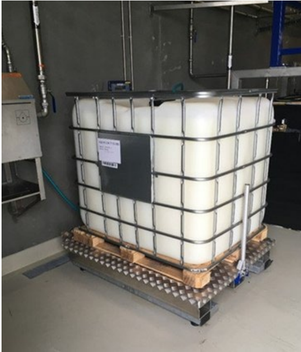
SP-Tilt med palletank