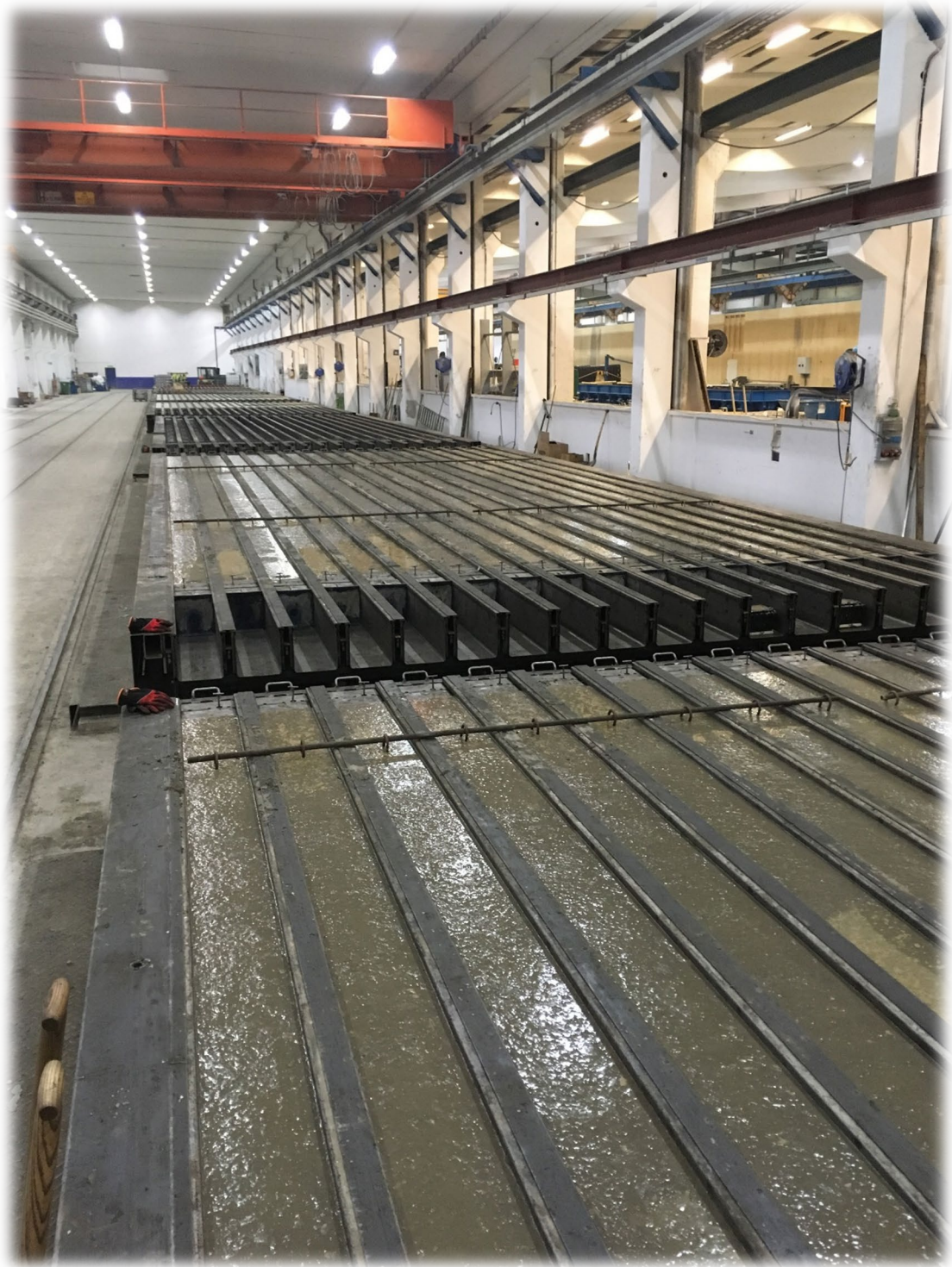
Billede: Jernbeton pæle produktion Sverige (Skanska AB)